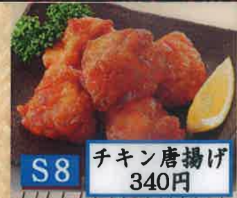
S8 チキン唐揚げ 340円