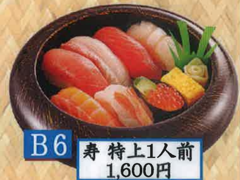
B6 寿 特上1人前 1,600円