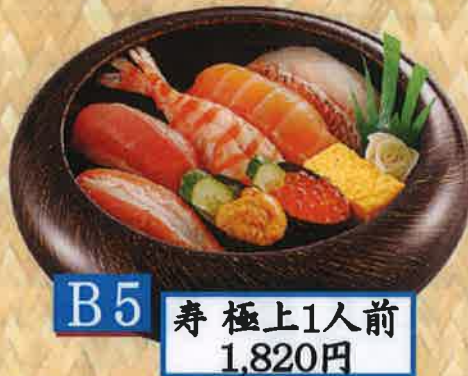
B5 寿 極上1人前 1,820円