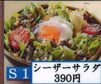
S1 シーザーサラダ 390円