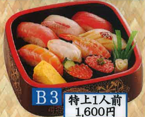
B3 特上1人前 1,600円