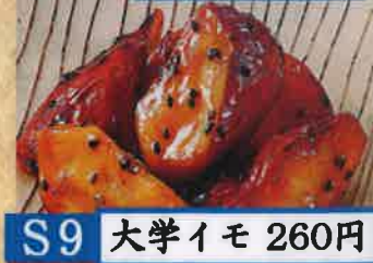
S9 大学イモ 260円