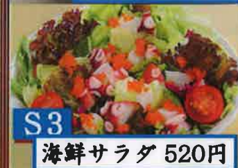
S3 海鮮サラダ 520円