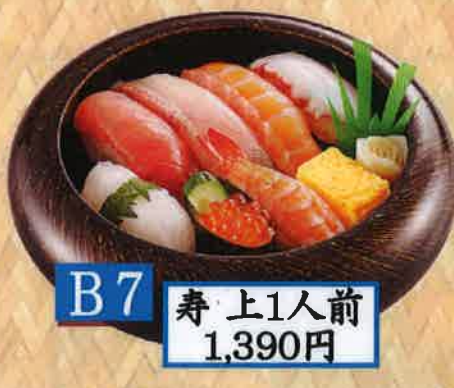
B7 寿 上1人前 1,390円