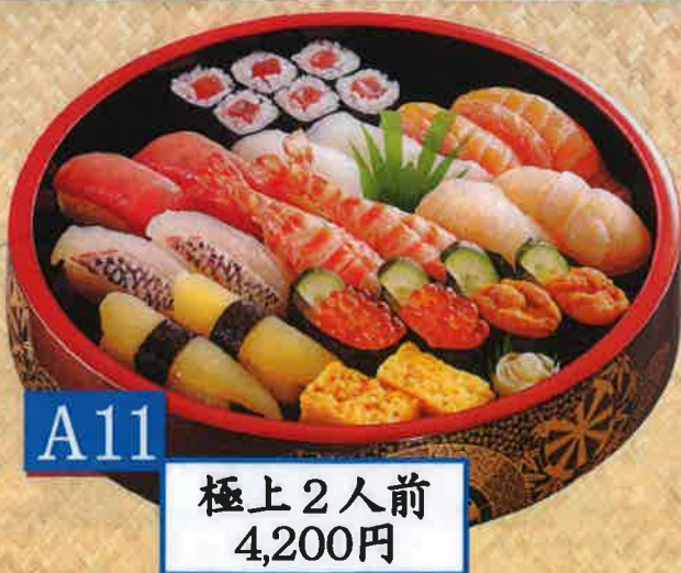
A11 極上2人前 4,200円