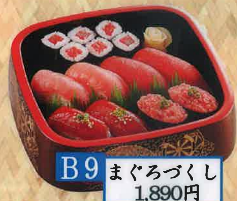
B9 まぐろづくし 1,890円