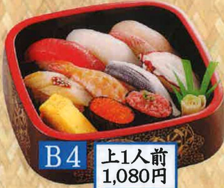
B4 上1人前 1,080円