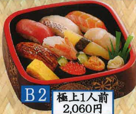
B2 極上1人前 2,060円