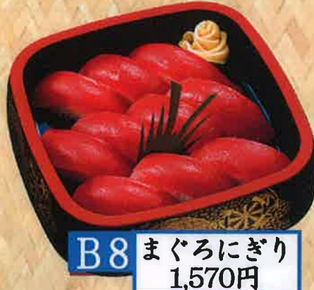
B8 まぐろにぎり 1,570円