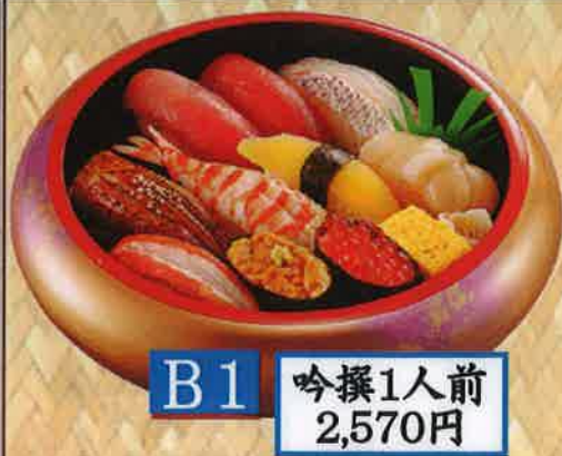
B1 吟撰1人前 2,570円